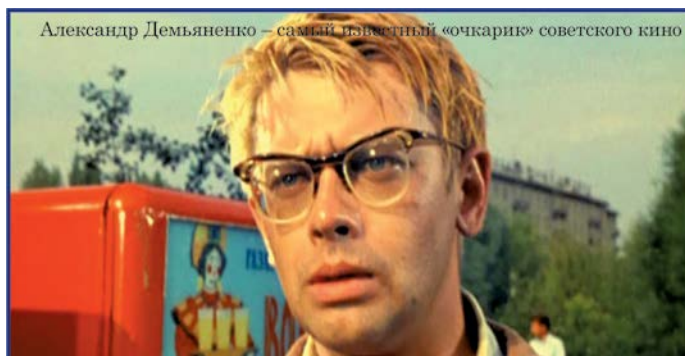
Александр Демьяненко – самый известный «очкарик» советского кино

его фотографии разного времени, то можно увидеть, что он всегда носил очень стильные очки, а в его знаменитом образе Шурика очки Browliners – чуть ли главная знаковая деталь, а сейчас эта модель – одна из самых модных. И отдельного упоминания заслуживают такие любители «очкового» экстрима, как Андрей Бартенев и Светлана Конеген, поскольку представить их без невообразимых дизайнерских очков вообще невозможно.