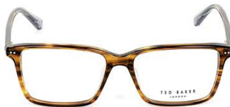
Ted Baker osborn 8121-105 5 999р.