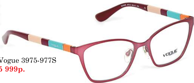
Vogue 3975-977S 5 999р.