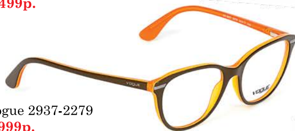
Vogue 2937-2279 5 999р.