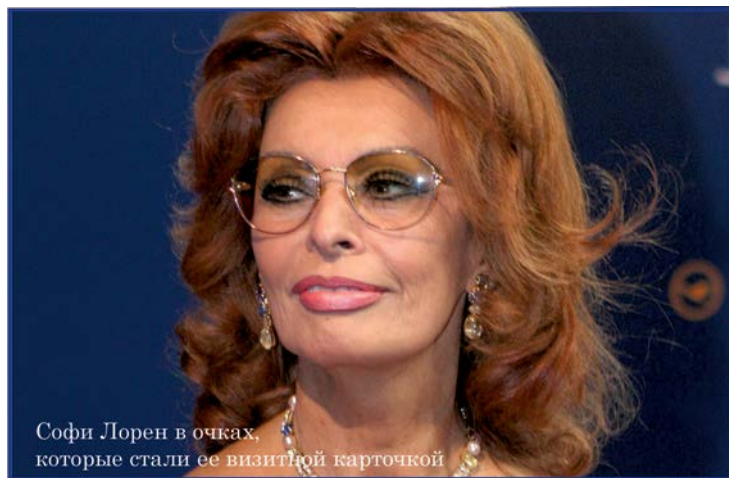
Софи Лорен в очках, которые стали ее визитной карточкой

В идеале, чтобы оправы были разноплановыми, под разный образ и настроение: парочка темных (одна максимально вам идущая, вторая максимально изменяющая выражение вашего лица), парочка светлых (одна тонкая металлическая, вторая не очень заметная на лице), парочка экстремальных (цветных, остро модных или оригинальных). Конечно, разумность нужна во всем — не нужно к каждому новому платью или туфлям заводить себе новую оправу, но и ходить в одних очках 20 лет не советую, мода распространяется и на этот замечательный аксессуар тоже!