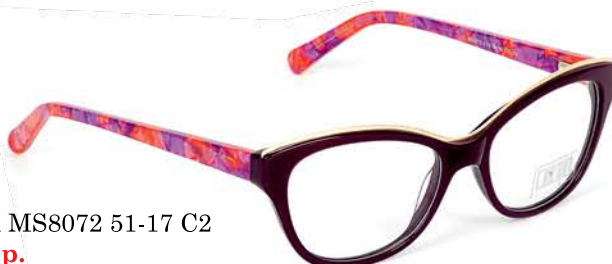
Merel MS8072 51-17 C2 3 499р.