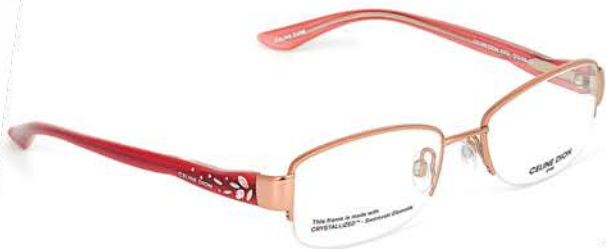
Celine Dion CD3194 5 999р.