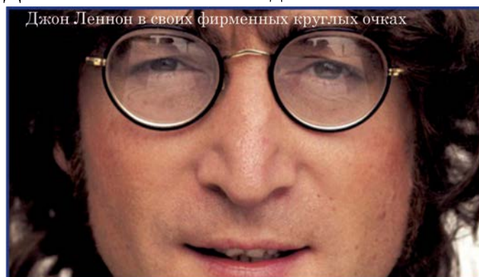
Джон Леннон в своих фирменных круглых очках

Такое впечатление, что «в моде» все формы сразу, но главным трендом 2015 являются круглые очки как у Джона Леннона — тишейды.