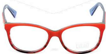
Merel MS8044 C03 3 499р.