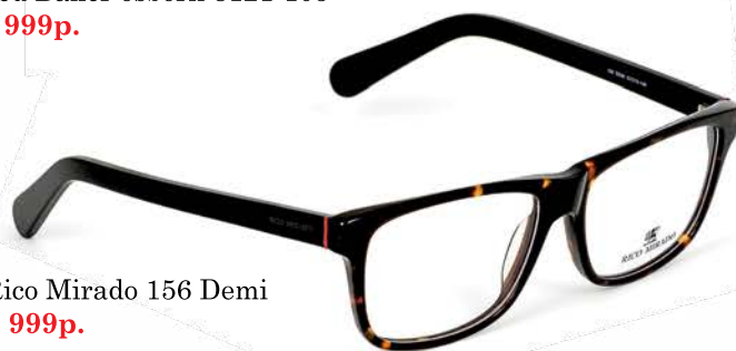
Rico Mirado 156 Demi 2 999р.