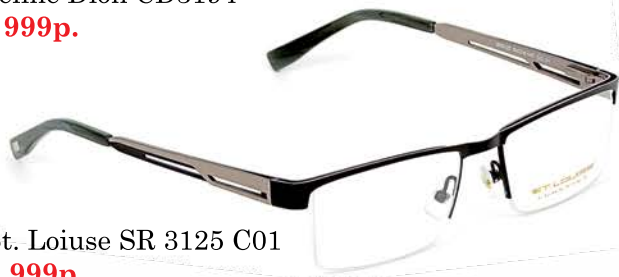
St. Loiuise SR 3125 C01 4 999р.