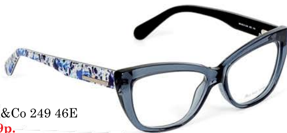
Max&Co 249 46E 5499р.