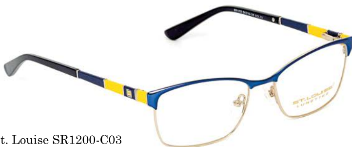
St. Louise SR1200-C03 4 999р.