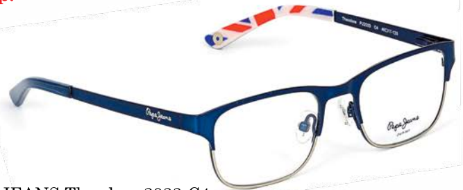
PEPE JEANS Theodore 2033-C4 2 999р.