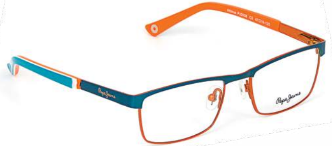
PEPE JEANS Atticus 2038-C3 2 999р.